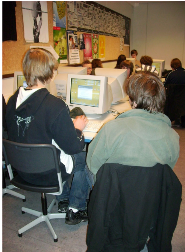
Unterricht in einem der drei Computerräume

Ab einem Jahresbeitrag von 20€ können Sie Mitglied werden.