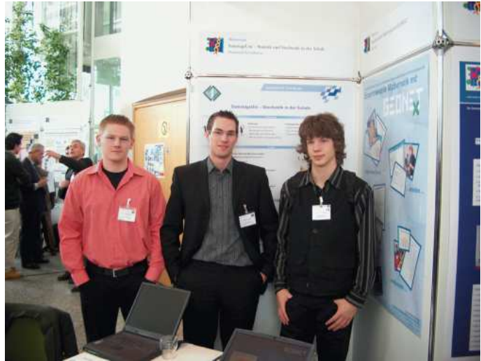
Präsentation der SamstagsUni auf der NATworking-Tagung der Robert-Bosch-Stiftung in Heidelberg

Die Zusammenarbeit von Schulen mit Hochschulen wird von der Robert-Bosch-Stiftung gefördert. Zu den 20 zurzeit geförderten Projekten gehört auch die SamstagsUni – eine Kooperation des LLG mit der Universität Dortmund, Abteilung Statistik (Förderzeitraum: Mai 2003 bis April 2006). In universitätsähnlichen Veranstaltungen (Vorlesungen, Übungen, Seminaren) werden Themen der angewandten Statistik den teilnehmenden Schülerinnen und Schülern vermittelt – eine Herausforderung für Mathematik-Interessierte parallel zum „normalen“ Unterricht und gleichzeitig eine hervorragende Vorbereitung auf das Studium.